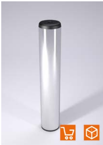
Exemple de montage